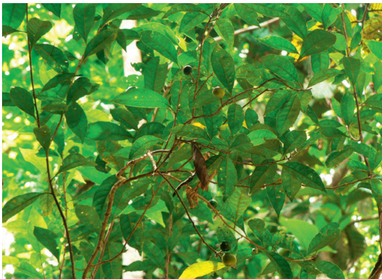
Reife und unreife Früchte des Baumes Leonia cymosa an der DPZ-Feldstation in Peru. Die Früchte verändern ihren Geruch, wenn sie reifen und werden deshalb vornehmlich von Primaten gefressen.