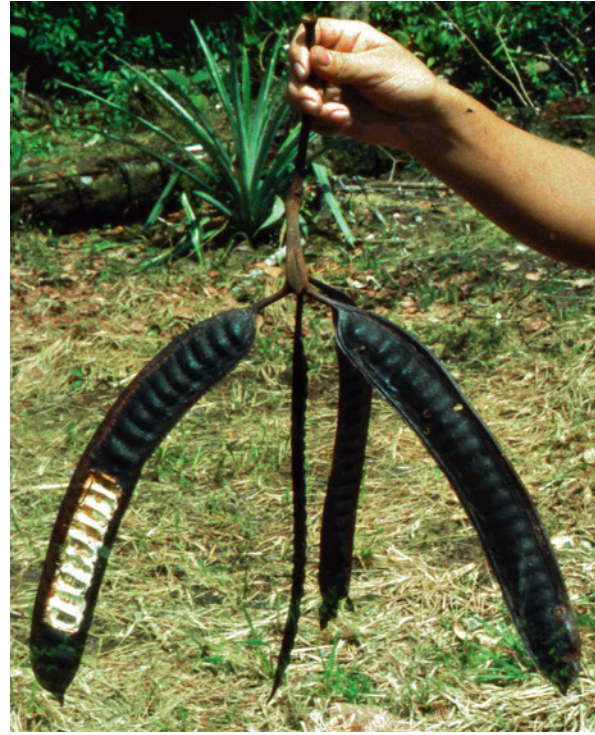
Fruchtstand eines Parkia -Baumes. Der zähflüssige Gummi in den Hülsen dient den Tamarinen als Nahrung. Die Samen der Bäume werden von den Affen verschluckt und später an anderer Stelle wieder ausgeschieden.

Dass die Samenausbreitung durch die Tamarine auch einen entscheidenden Einfluss auf die Waldregeneration hat, zeigte eine weitere Studie an der DPZ-Freilandstation. In der Nähe der Station befindet sich ein rund vier Hektar großes Gebiet, das gerodet und in