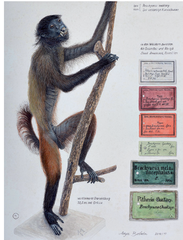
Spix-Schwarzkopfuakari ( Cacajao ouakary ) gezeichnet von Anja Bolata.