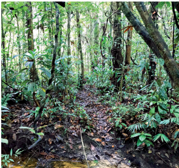
Die Feldstation EBQB liegt in einer wenig gestörten Region Amazoniens.

der Primaten durchgeführt. Darüber hinaus nutzten auch andere Wissenschaftler*innen und Studierende die Station für ihre Untersuchungen an anderen Tiergruppen und Pflanzen. 2018 wurde sogar eine neue Vogelspinnenart ( Cyriocosmus giganteus ) an der Station entdeckt.