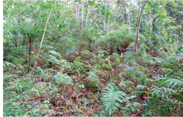
Sekundärwald, der auf einer ehemaligen Wasserbüffelweide wächst. Der sich regenerierende Wald besteht aus jungen, kleineren Bäumen und einer dichten Krautschicht, da mehr Licht bis zum Boden gelangt.

Für eine Pflanze, deren Samen hauptsächlich durch Tiere verbreitet werden, ist es von Vorteil, wenn ihre Früchte leicht erkannt und gefunden werden. Wichtige Merk-