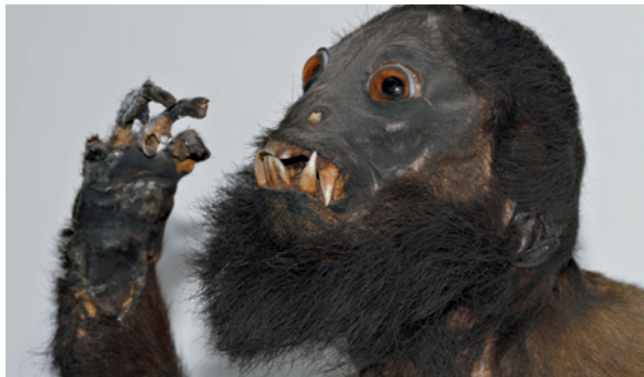
Spix-Affen-Präparat: Satansaffe ( Chiropotes satanas ).

Wesche M (2020): Zwei Bayern in Brasilien – Johann Baptist Spix und Carl Friedrich Philipp Martius auf Forschungsreise 1817 bis 1820. Allitera Verlag, München.