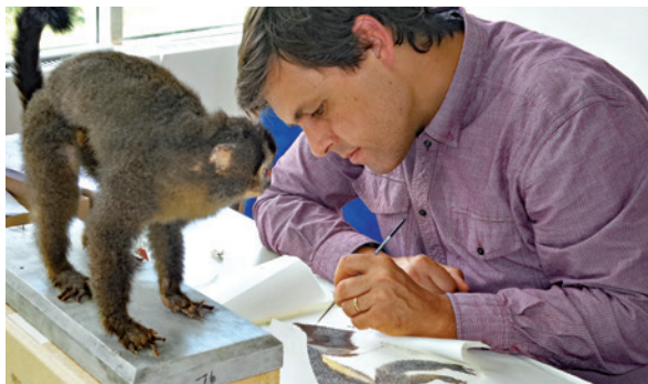
Die Affen-Präparate wurden von den Künstler*innen originalgetreu gezeichnet.