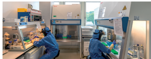
Im Ancient-DNA-Labor im DPZ werden alte DNA-Proben unter streng isolierten Bedingungen analysiert, um sie vor Verunreinigungen zu schützen.

Erst 2018 wurden dann aufgrund genetischer Analysen die beiden heutigen Arten festgelegt: der nördlich vom Amazonas lebende Gelbbauchzwergseidenaffe ( Cebuella pygmaea ) und der südlich vom Amazonas vorkommende Weißbauchzwergseidenaffe ( Cebuella niveiventris ). Die spannende Frage war nun, ob es sich bei Spix' Zwergseidenaffen wirklich um die nördliche Art handelt,