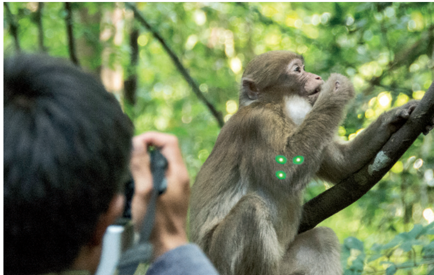
Fotogrammetrie mit Hilfe paralleler Laserprojektionen erlaubt das berührungsfreie Erfassen der Körpergröße. Die Wachstumsrate junger Assammakaken ( Macaca assamensis) an der Feldstation Phu Khieo in Thailand wird unter anderem von vorgeburtlichem Stress im Mutterleib beeinflusst.