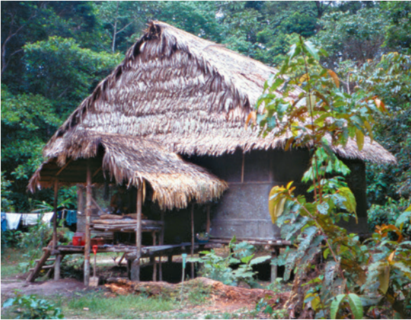
Die Feldstation bestand 1998 noch aus einer einfachen Hütte ohne fließend Wasser und Strom.