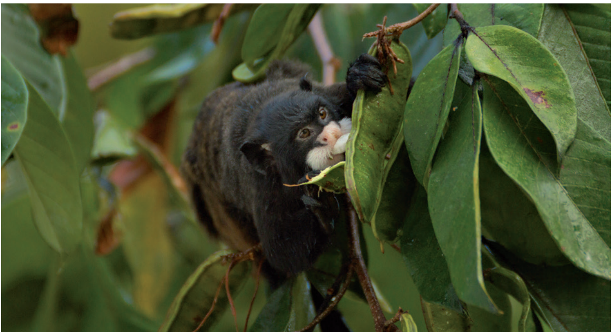
Ein Schnurrbarttamarin hat die Frucht eines Inga-Baumes aufgebissen und zieht gerade einen Samen heraus, um das ihn umgebende Fruchtfleisch zu fressen.