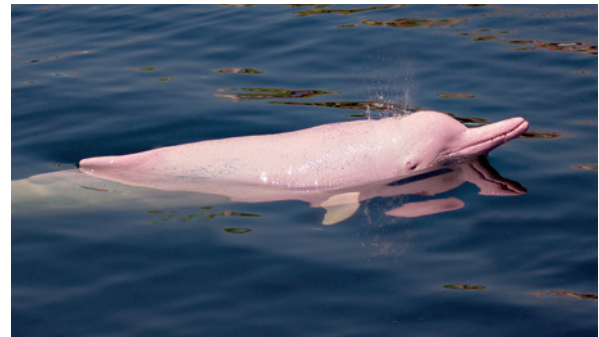
Der pinke Amazonasdelfin ( Inia geoffrensis ) ist im Amazonas beheimatet und gehört zu den vielen seltenen und bedrohten Arten des Ökosystems.