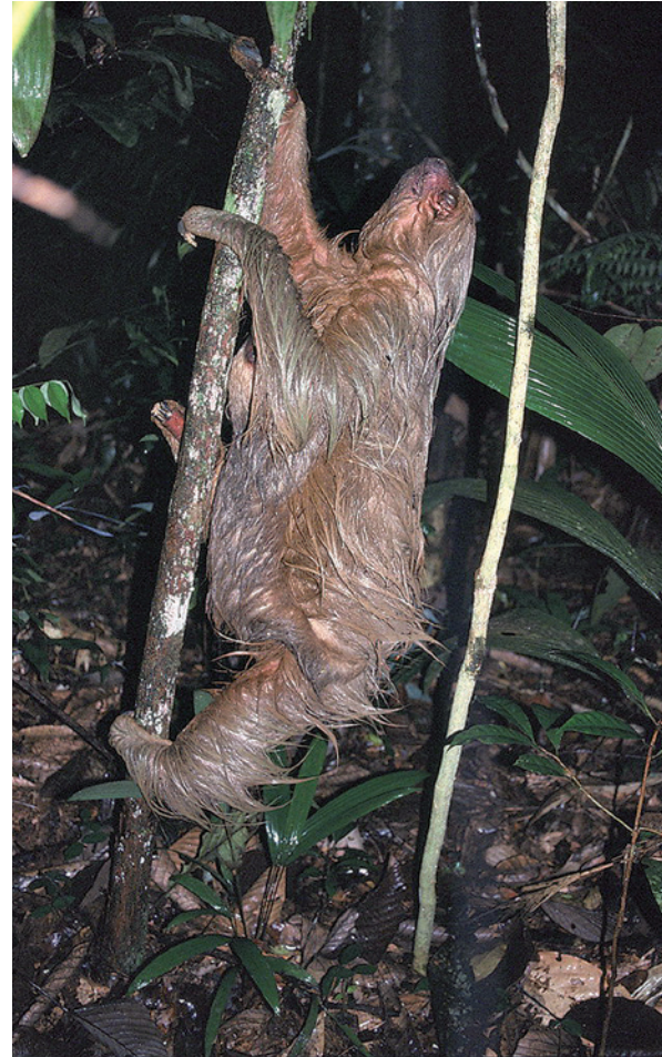
Frisch dem Plumpsklo entstiegen. Ein Faultier auf seinem Weg zurück in den Baum.

Heymann EW, Flores Amasifuén C, Shahuano Tello N, Tirado Herrera ER, Stojan-Dolar M (2011): Disgusting appetite: Two-toed sloths feeding in human latrines. Mammalian Biology 76: 84-86.