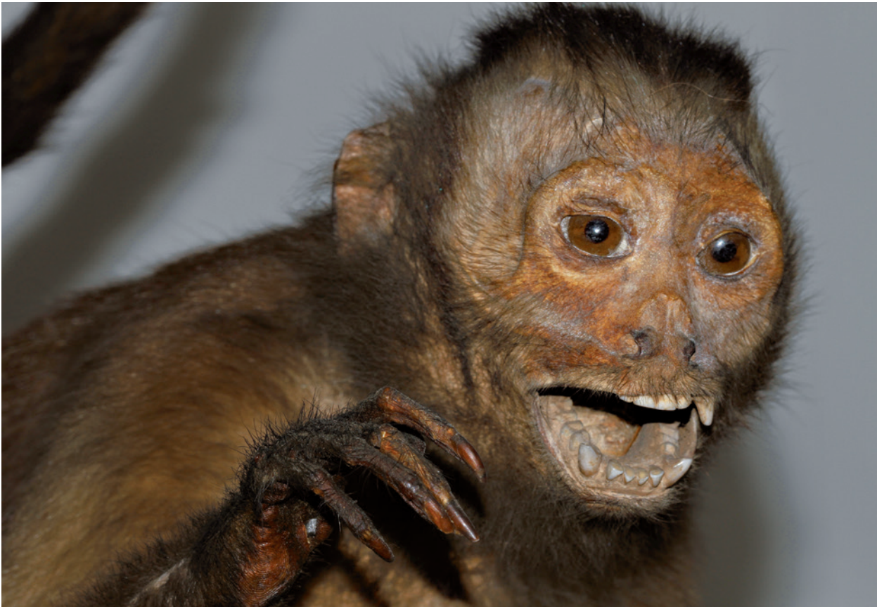
Spix-Affen-Präparat Großkopf-Kapuzineraffe ( Cebus macrocephalus ).

gung abgeschirmten Bedingungen, mit speziellen Methoden aufbereitet und analysiert werden. So erhalten die Forschenden wertvolle Informationen von Tieren, die bereits seit 200 Jahren in Kisten und Schränken von Museen lagern.