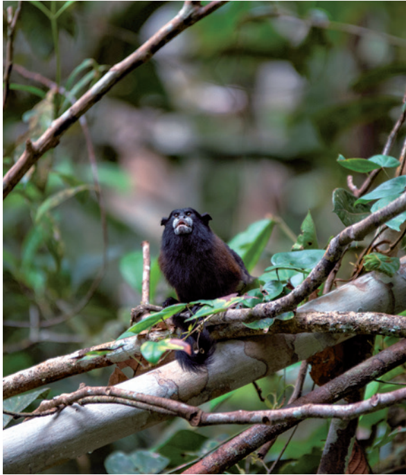
Ein Schwarzstirntamarin äußert einen Alarmruf.