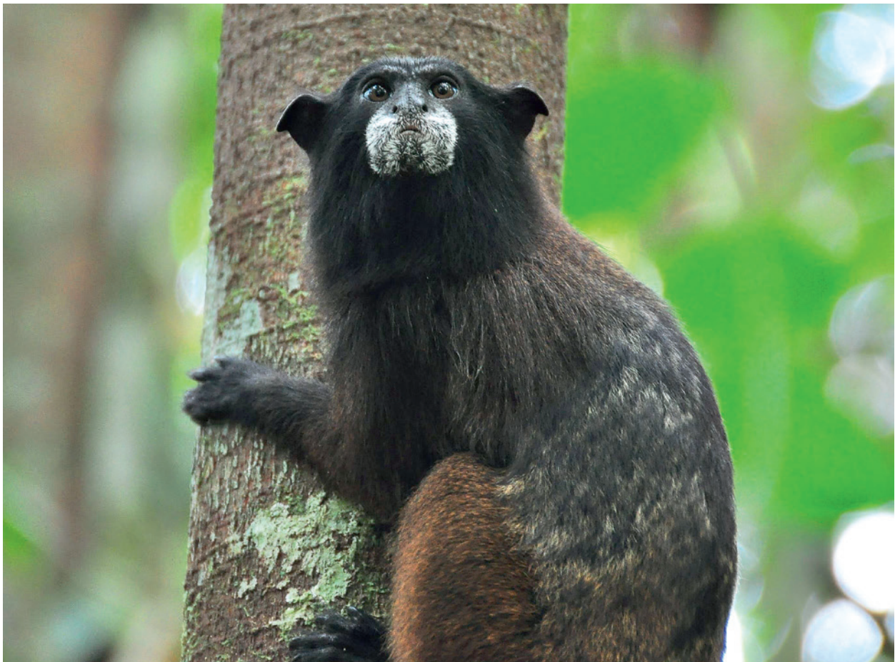
Ein Schwarzstirntamarin ( Leontocebus nigrifrons ).

Dieser Prozess der Zweiphasen-Samenausbreitung (erste Phase durch Primaten, zweite Phase durch Mistkäfer) kommt in tropischen Wäldern sehr häufig vor. Beide Phasen beeinflussen das schlussendliche Werden oder Sterben der Pflanzensamen. Forscher*innen an der Freilandstation in Peru haben das Zweiphasensystem Tamarine-Mistkäfer genauer untersucht. Dafür beobachteten sie eine gemischte Gruppe von Schnurrbart- und Schwarzstirntamarinen, die gemeinsam in einem