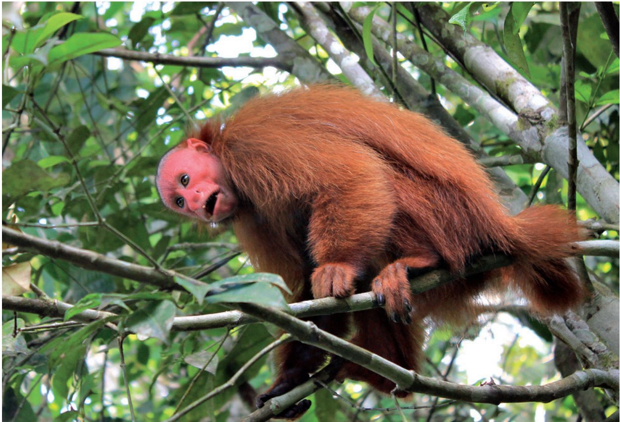
Der Ucayali-Rotkopfuakari ( Cacajao calvus ucayalii ) schaut gelegentlich im Camp vorbei.