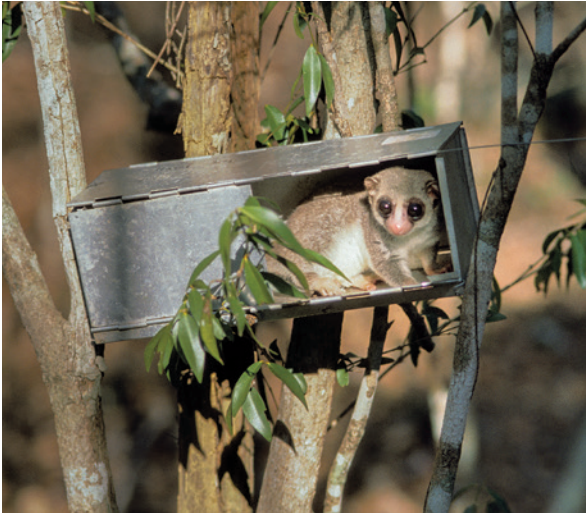
Ein Westlicher Fettschwanzmaki ( Cheirogaleus medius ) in einer Lebendfalle nahe der Forschungsstation Kirindy auf Madagaskar.

auch Rückschlüsse auf ihren geographischen Ursprung und ihre stammesgeschichtlichen Beziehungen, und damit auch auf die Evolution der Arten. Zudem kann man anhand von Kotproben die Zusammensetzung der Mikroorganismen- und Parasitengemeinschaften bestimmen, die im Darm der Tiere vorkommen und somit Informationen über die Gesundheit der Tiere erhalten. Hormonwerte, beispielsweise aus Urin- oder Kotproben gewonnen, geben Auskunft über Stress-, Reproduktions- oder Gesundheitsstatus, welche, in Kombination mit Verhaltensbeobachtungen, Aussagen über Nahrungskonkurrenz, soziale Rivalitäten oder Paarungszeiten erlauben.