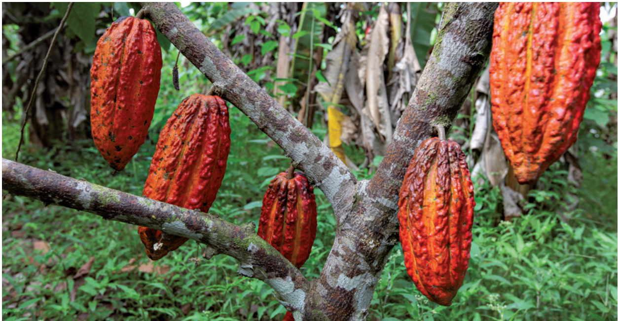
Kakao ist eine von vielen Nahrungsmitteln, die aus dem Regenwald stammen.

Die Gründe dafür sind vielfältig. Die größten Flächenverluste sind der Landwirtschaft zuzuschreiben. Sie werden als Weideland für Rinder oder als Ackerland für den An-