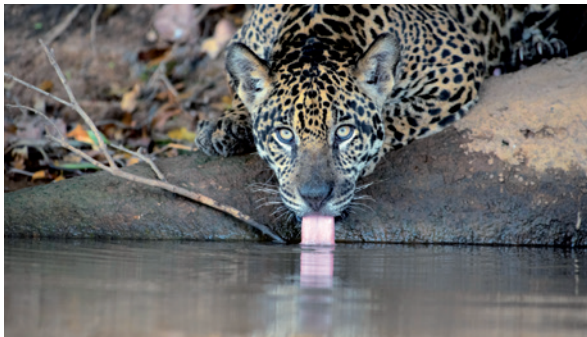
Der Jaguar ( Panthera onca ) ist die einzige Großkatzenart, die im Amazonasregenwald vorkommt. Auch sie gilt als gefährdet.

Trompeter I (2017): Improvement of stress resistance and quality of life of adults with nervous restlessness after treatment with a passion flower dry extract. Complementary Medicine Research 24: 83-89.