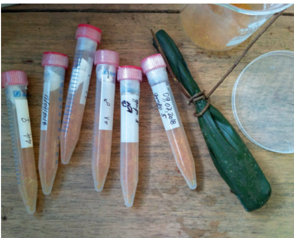
Aus Kotproben wird der Verwandtschaftsgrad zwischen den vermeintlichen Eltern und ihren Kindern bestimmt. Dafür wird im Labor DNA aus den Proben extrahiert und anschließend ein „genetischer Fingerabdruck“ für jedes Familienmitglied erstellt.