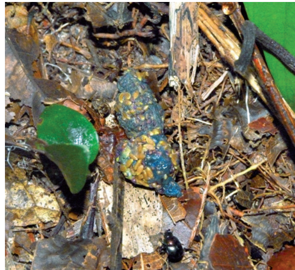
Ein Mistkäfer im Anmarsch auf den Kot eines Schnurrbarttamarins.

male sind dabei die Farbe und der Geruch, die jeweils Reifegrad und Qualität der Früchte anzeigen können. Betrachtet man Vögel und Affen als Samenausbreiter, so orientieren sich erstere vor allem visuell, während letztere auch einen gut entwickelten Geruchssinn haben. Die Wissenschaftler*innen um Eckhard W. Heymann haben in Feldstudien herausgefunden, dass sich die Pflanzen an ihre jeweiligen Samenausbreiter anpassen: Pflanzen, deren Samen durch Affen verbreitet werden, signalisieren den Reifegrad ihrer Früchte durch Geruch,