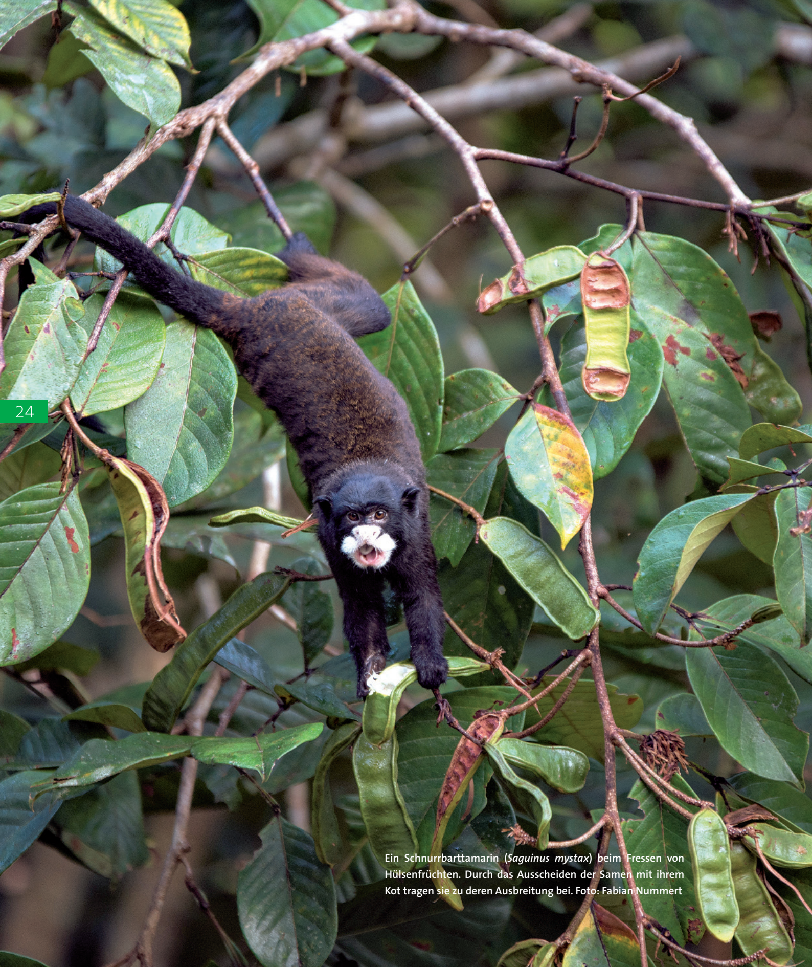
Ein Schnurrbartamarin ( Saguinus mystax ) beim Fressen von Hülsenfrüchten. Durch das Ausscheiden der Samen mit ihrem Kot tragen sie zu deren Ausbreitung bei.