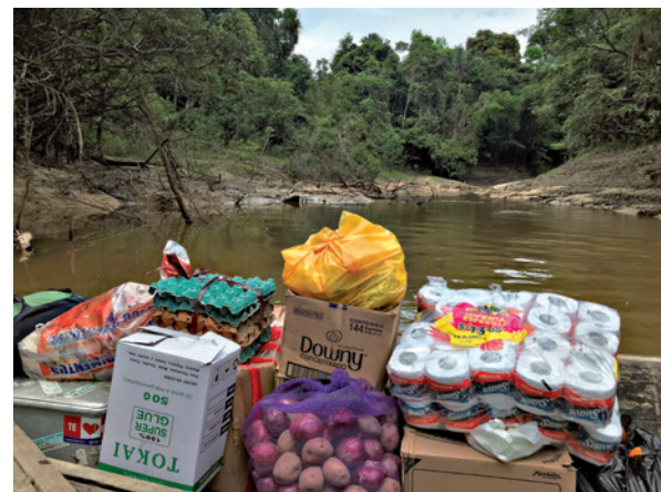
Lebensmittel und Dinge des täglichen Bedarfs werden aus Iquitos zur Feldstation transportiert.