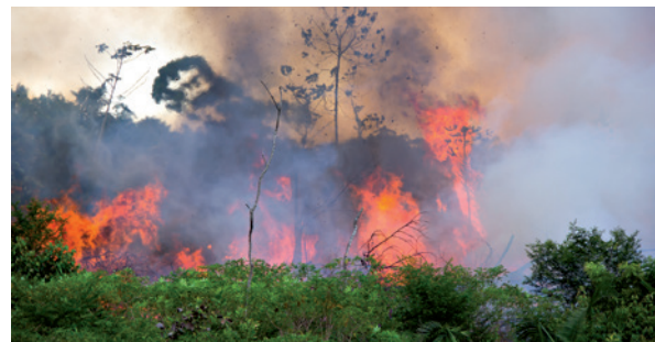
Der Regenwald brennt. Brandrodung zerstört die Ökosysteme und führt zu noch höheren Mengen des Treibhausgases Kohlenstoffdioxid in der Atmosphäre.

So vielfältig wie ihre Ursachen sind auch die Folgen der Regenwaldzerstörung, die schon jetzt vielerorts zu spüren sind. Menschen verlieren ihren Lebensraum und jahrhundertealte indigene Kulturen verschwinden. Die immense Artenvielfalt wird zerstört, Tiere, Pflanzen und Pilze sterben aus und verschwinden damit für immer von unserer Erde. Damit schrumpft auch die genetische Vielfalt. Das regionale und globale Klima droht zu kippen und globale Wasserkreisläufe werden empfindlich gestört, was mit Überschwemmungen und Dürren einhergeht.