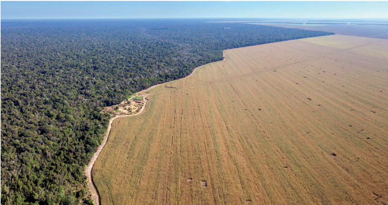
Entwaldung am Amazonas. Das Foto zeigt den Parque Indígena do Xingu im Amazonas-Regenwald, in dessen Umgebung sich große Soja-Anbaugebiete befinden.

bau von Soja, Kautschuk, Zuckerrohr oder Kakao verwendet. Gerade Soja wird zum großen Teil als Ernährung für Nutztiere in Europa verwendet. Darüber hinaus muss Tropenwald für den Bau von Staudämmen zur Energiegewinnung oder für Straßen weichen. Auch der Abbau von Bodenschätzen, wie zum Beispiel Gold und die Gewinnung von Tropenhölzern sind Gründe für die Regenwaldvernichtung.