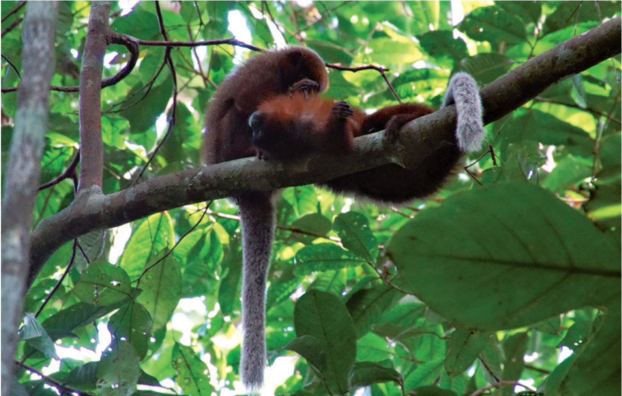
Ein Springaffenpaar bei der sozialen Fellpflege. Das Weibchen investiert bei Kupferroten Springaffen mehr in die Paarbeziehung als das Männchen.