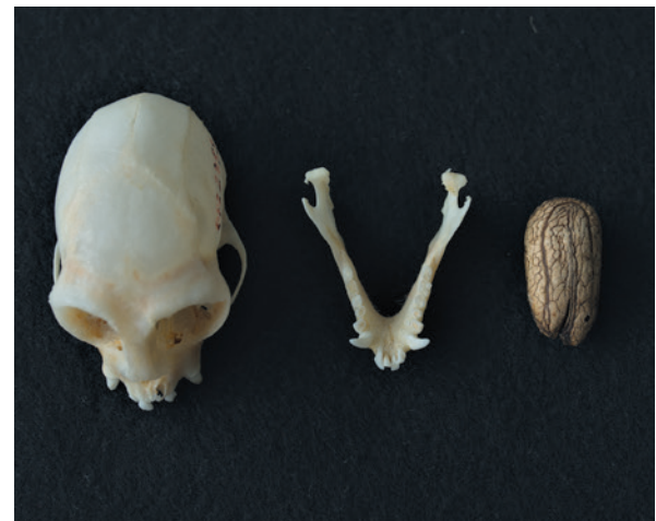
Schädel eines Schwarzkopftamarins ( Leontocebus illigeri ) und eines Samens der Pflanze Abuta grandifolia . Die kleinen Tamarine schlucken erstaunlich große Samen. Dieser Samen passt gerade so durch den Kiefer des Primaten.

Seit 1994 wurden an der DPZ-Forschungsstation in Peru Studien zur Samenausbreitung durch zwei Krallenaffenarten durchgeführt. Die Nahrung der Schnurrbartamarine ( Saguinus mystax ) und der Schwarzstirntamarine ( Leontocebus nigrifrons ) besteht zu mehr als der Hälfte aus Fruchtfleisch, gefolgt von Baumexsudaten, Blütennektar und Insekten. Insgesamt konnten in einer ersten Studie zur Samenausbreitung im Kot der kleinen Affen die Samen von 88 verschiedenen Pflanzenarten nachgewiesen werden. Die Tiere verdauen nur das Fruchtfleisch, die Samen werden vollständig mit dem Kot wie-