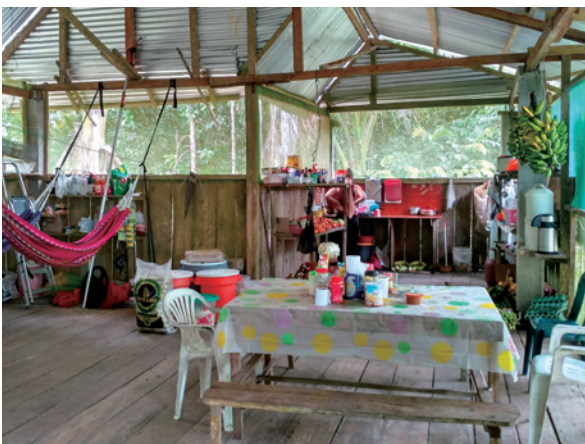
Im Küchen- und Aufenthaltsbereich findet das Gemeinschaftsleben im Camp statt.

Die DPZ-Studien an der EBQB konzentrierten sich hauptsächlich auf drei Arten: Schwarzstirntamarine ( Leontocebus nigrifrons ), Schnurrbarttamarine ( Saguinus mystax ) und Kupferrote Springaffen ( Plecturocebus cupreus ). Es wurden Studien zur Ökologie, insbesondere Tier-Pflanze-Interaktionen, sowie zu Sozial- und Paarungssystemen