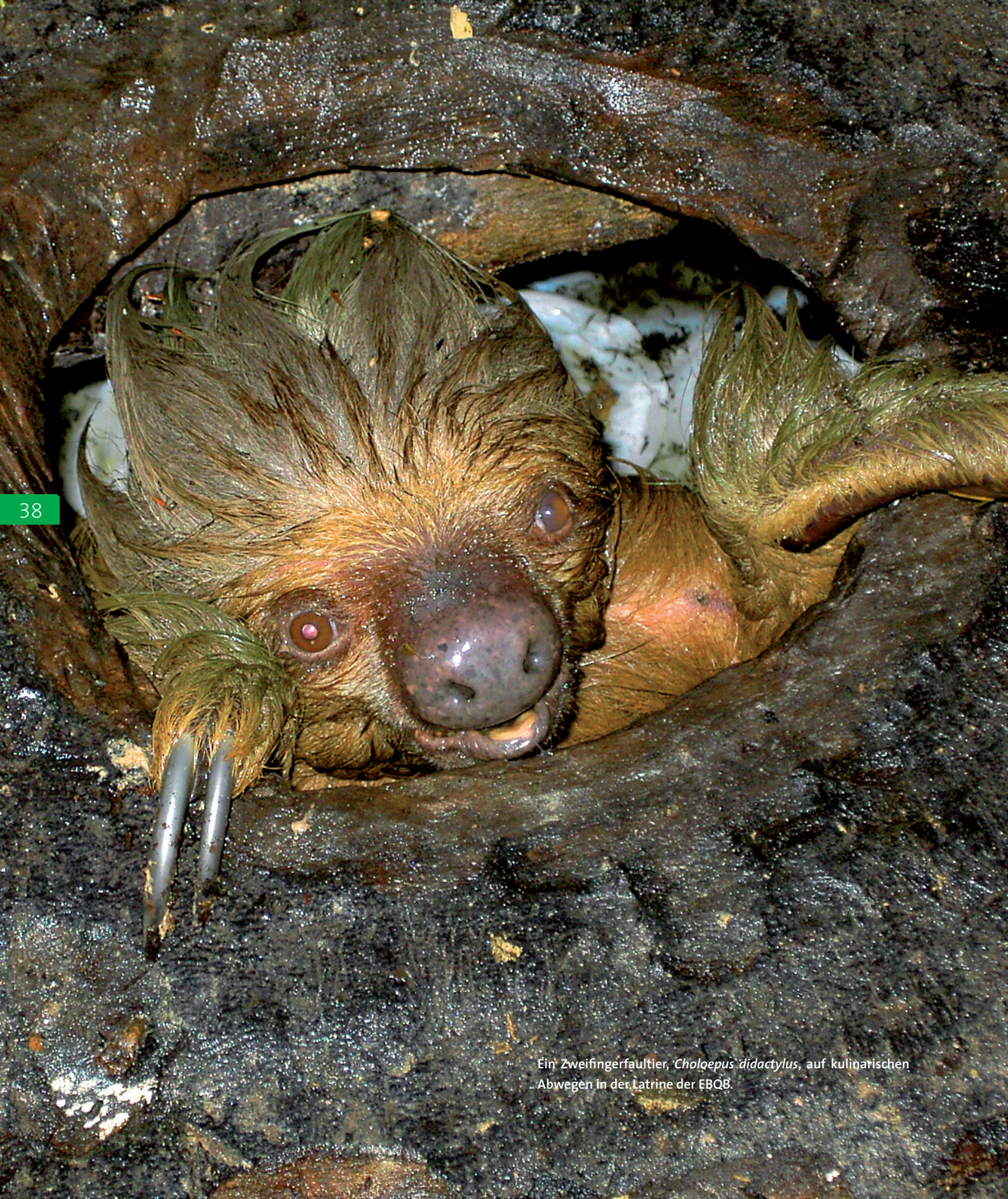
Ein Zweifingerfaultier, Choloepus didactylus , auf kulinarischen Abwegen in der Latrine der EBQB.