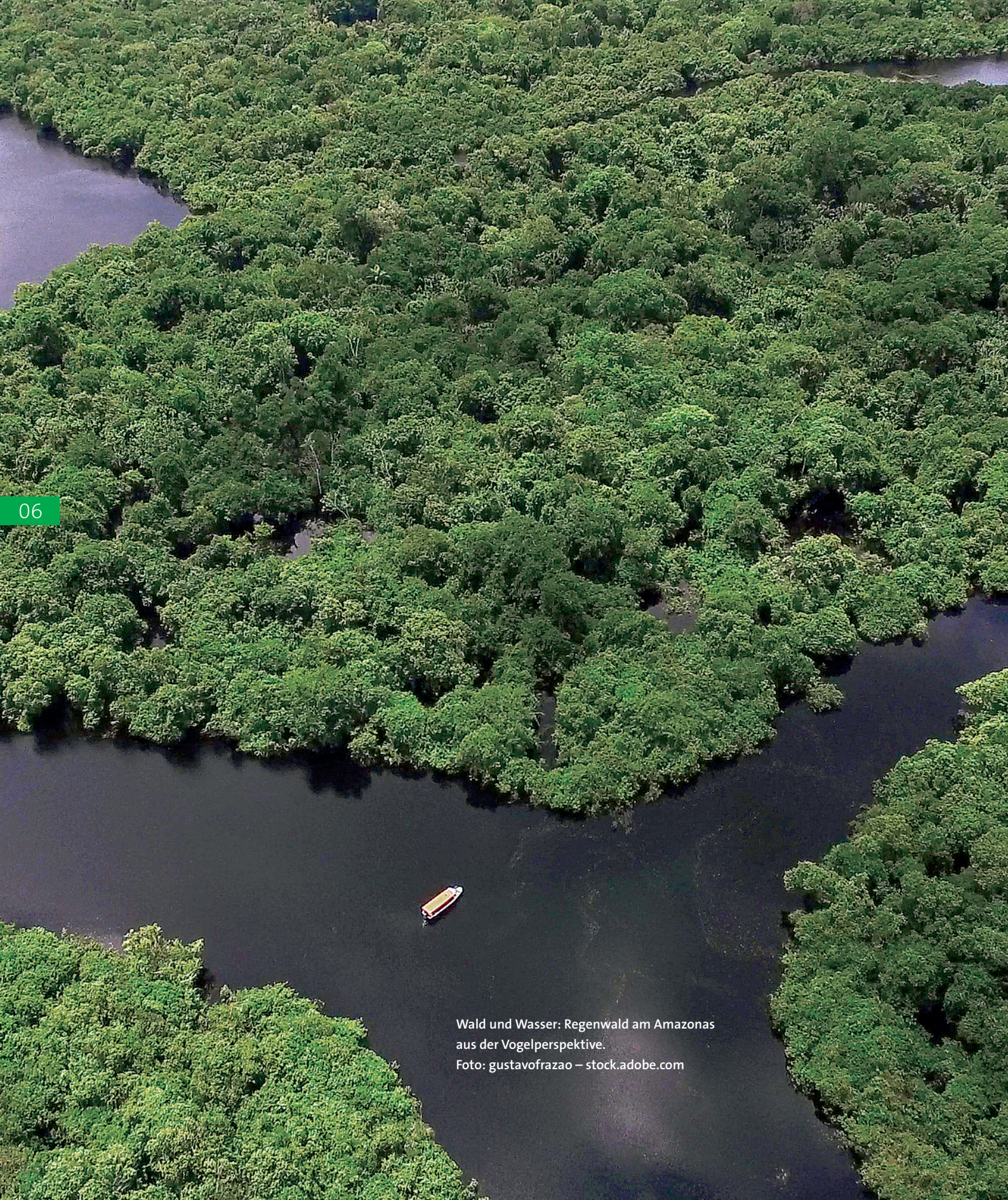
Wald und Wasser: Regenwald am Amazonas aus der Vogelperspektive.