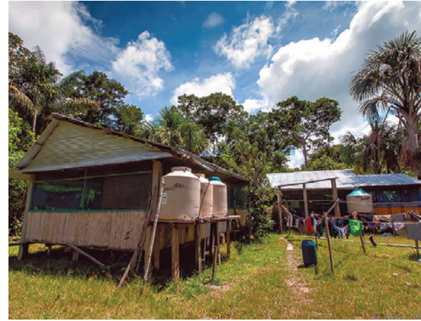
Heute bietet die Feldstation etwas mehr Komfort, mit getrennten Arbeits- und Wohnbereichen sowie fließend Wasser und elektrischem Licht.

teilweise aber auch sehr hügelig und von vielen kleinen Bachläufen durchzogen, in deren Nähe es sumpfig sein kann. Ein geschlossenes Kronendach in 25 bis 35 Metern Höhe wird von einzelnen Bäumen mit einer Höhe von 40 Metern oder mehr überragt. Der Unterwuchs ist mäßig dicht, kann aber während der Naturverjüngung in Bestandslücken, die durch umgestürzte Bäume entstehen, sehr dicht werden. Man findet etwa 300 verschiedene Baumarten auf einem Hektar Wald.