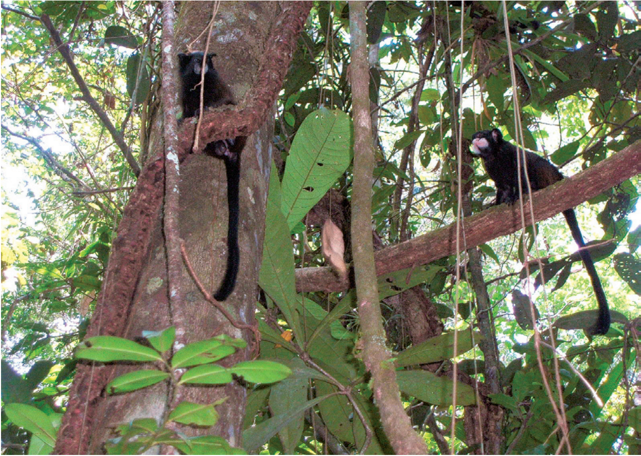
Langzeituntersuchungen an Schnurrbart- (links) und Schwarzstirntamarinen (rechts) zeigten, dass die beiden Arten über lange Zeiträume vergemeinschaftet blieben.

darauf reagieren. Studien legen nahe, dass die Schnurrbarttamarine ihre Aufmerksamkeit auf Raubfeinde aus den oberen Stockwerken richten, die Schwarzstirntamarine dagegen Fressfeinde, die sich vom Boden nähern, im Blick haben. Für die Schwarzstirntamarine ergibt sich außerdem ein Vorteil der Assoziation aus der Erbeutung von Insekten, die den Schnurrbarttamarinen entkommen und in untere Bereiche des Waldes geflüchtet sind. Nachteile von Assoziationen sind die gelegentlichen Auseinandersetzungen an kleinen Nahrungsquellen. Die Häufigkeit und Dauerhaftigkeit von Assoziationen belegt jedoch, dass die Vorteile die Nachteile überwiegen.