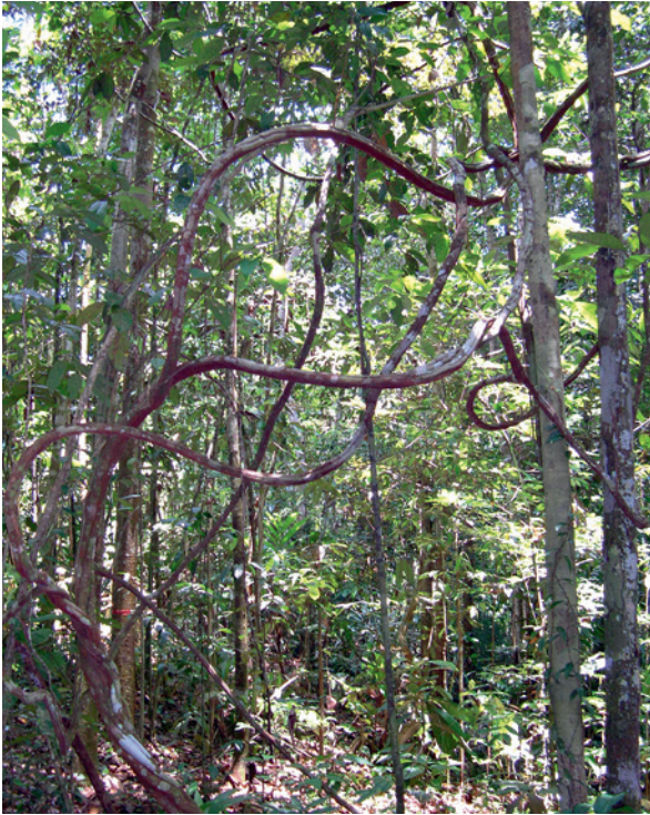
Primärer Regenwald in Peru. Im Gegensatz zum Sekundärwald ist die Kronenbedeckung höher, die Krautschicht weniger dicht.

Areal leben, das rund 36 Hektar primären Regenwald und etwa vier Hektar Sekundärwald umfasst. Die kleinen Affen verbreiten über ihren Kot die Samen von 166 verschiedenen Pflanzen. An den Kotproben konnten die Wissenschaftler*innen 25 verschiedene Mistkäferarten identifizieren, die die Samen in einer Tiefe von 0,5 bis 11 Zentimeter vergraben. Die Forscher*innen beobachteten die Entwicklung von über 500 Samen über mehr als ein Jahr. Dabei fanden sie heraus, dass das Vergraben der Samen ihre Überlebenschance erhöhte und zwar vor allem im Sekundärwald, wo mehr Samen auskeimten als im Primärwald. Insbesondere in sich regenerierenden Wäldern scheint das Zweiphasensystem der Samenausbreitung deshalb von großer Bedeutung zu sein.