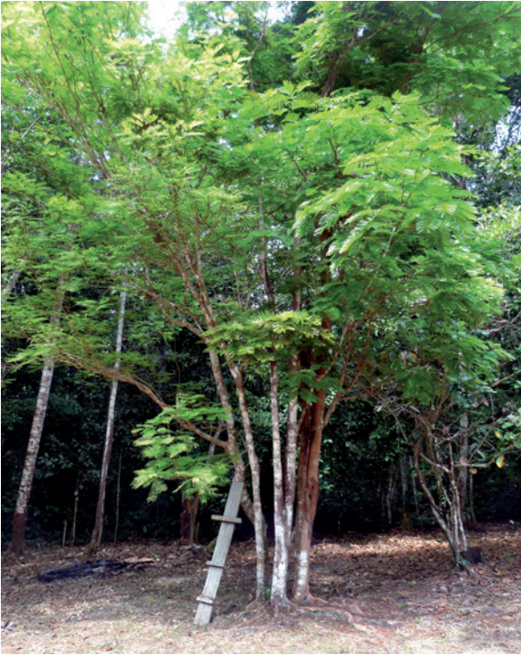
Junge Parkia panurensis -Bäume in der Nähe der DPZ-Forschungsstation.

der ausgeschieden. So werden die Samen im Umkreis von bis zu 600 Metern von der Mutterpflanze ausgebreitet. Beim Schlucken der Samen vollbringen die 300 bis 600 Gramm schweren Tiere zum Teil enorme Leistungen. Die Samen können bis zu 2,5 Zentimeter lang sein und haben teilweise Durchmesser von über einem Zentimeter. Um Vergleichbares zu schaffen, müsste ein Mensch einen Mangokern oder eine kleine Kokosnuss verschlucken. Der Gang durch den Verdauungstrakt schadet den Samen nicht. Keimungsexperimente mit 64 verschiedenen Samenarten zeigten, dass die von den Tamarinen verschluckten Samen genauso gut und genauso schnell wie nicht verschluckte Samen auskeimen.